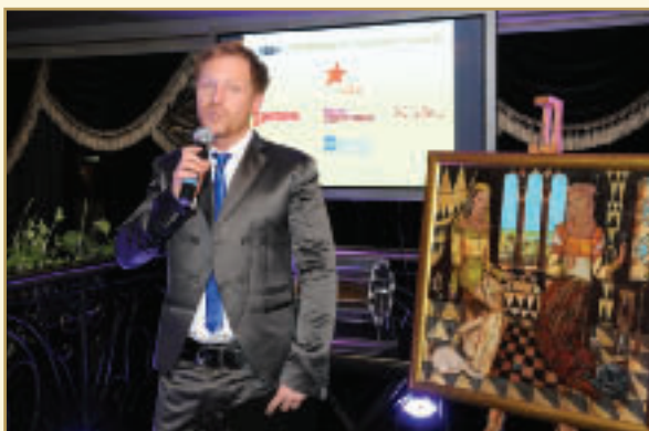
Розіграш призів під час благодійного вечора з нагоди відкриття лабораторії

Проект "Точка життя" визнаний кращим на національному конкурсі "Благодійник року — 2009". За виконання цього проекту Всеукраїнський благодійний фонд "Крона" групи компаній "НІКО" здобув перемогу у номінації "Корпоративний благодійний фонд".