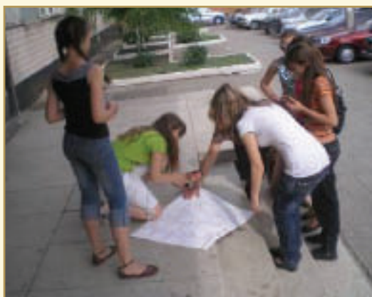
Діти організували акцію проти насильства в сім'ї "Ця рука ніколи не вдарить дитину"

Упродовж 2009 року до служб розв'язання конфліктів звернулися 177 дітей — учнів шкіл Кіровограда та області, 38 батьків, 30 вчителів.