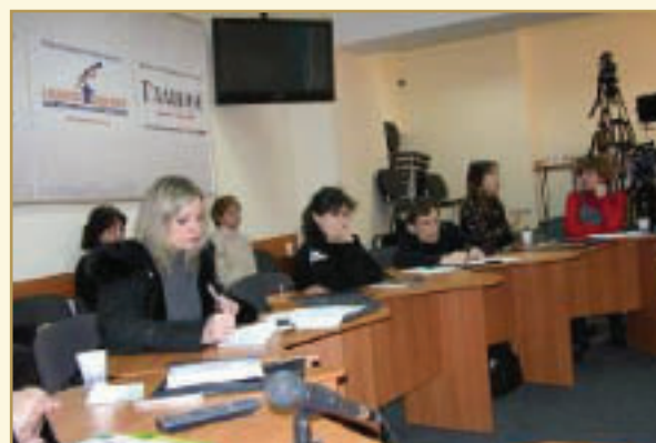
Круглий стіл з питань доступності туризму для людеї з інвалідністю

Працівниками та волонтерами організації-партнера проведено семінари у П'євїві, Поптаві, Києві, Харкові, Євпаторії з питань організації туристичних послуг та відпочинку для людеї з інвалідністю. Були представлені рішення щодо організації доступності туристичних споруд, транспорту та послуг, безпеки туризму та відпочинку для людеї з інвалідністю, допомоги ї організації відпочинку для дітей з різними фізичними порушеннями: руху, зору, слуху і т.і. У семінарах взяли участь 120 представників туристичного бізнесу та недержавних організацій інвалідів.