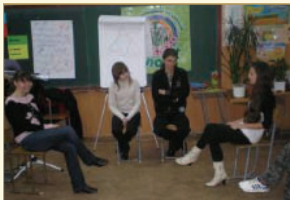
Зустріч медіаторів з учнями, які опинилися в конфлікті й не можуть подопати його самі.