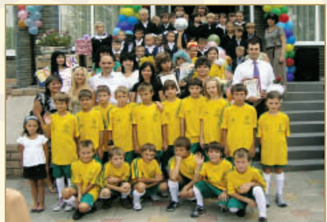
До Дня знань 1 Вересня представники "НІКО- Донецьк" привітали дітей та вчителів

У танцювального колективу "Dancer-X", де займаються переважно дівчата вік 10 до 17 років, не менше досягнень. Колектив здобув перше місце на щорічних міських змаганнях зі спортивної аеробіки серед дітей-сиріт і дітей, позбавлених батьківської опіки. І на обласному конкурсі "Держайте, ви талановиті!" дівчата вразили усіх своїм талантом і стали переможцями. У грудні 2009 діти приїхали до Києва для участі у Всеукраїнському фестивалі "Шедрик-ведрик збирає зірочки", де також зайняли перше місце. Зараз колектив готується до участі у Всеукраїнському конкурсі "Запали мрію", відбірковий тур якого пройде в м. Харкові, а заключний - в м. Києві.