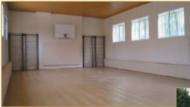
Так тепер виглядають спортивна зала та футбольне поле