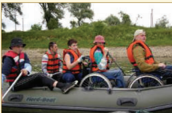
Так люди з інвалідністю можуть активно відпочивати