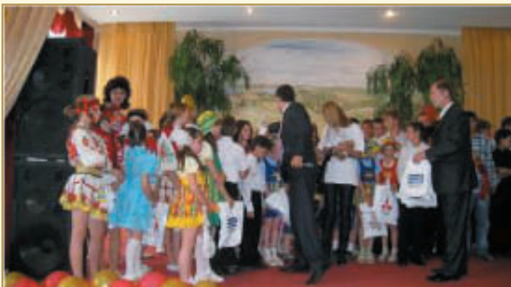
Заслужені нагороди танцювального колективу

У танцювального колективу "Dancer-X", де займаються переважно дівчата вік 10 до 17 років, не менше досягнень. Колектив здобув перше місце на щорічних міських змаганнях зі спортивної аеробіки серед дітей-сиріт і дітей, позбавлених батьківської опіки. І на обласному конкурсі "Держайте, ви талановиті!" дівчата вразили усіх своїм талантом і стали переможцями. У грудні 2009 діти приїхали до Києва для участі у Всеукраїнському фестивалі "Шедрик-ведрик збирає зірочки", де також зайняли перше місце. Зараз колектив готується до участі у Всеукраїнському конкурсі "Запали мрію", відбірковий тур якого пройде в м. Харкові, а заключний - в м. Києві.