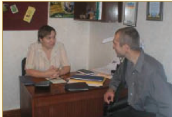
До громадської приймальні звертаються батьки, і фахівці допомагають їм у розв'язанні багатьох складних конфліктних ситуацій.